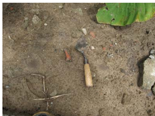
圖說：遺址東側出土之夾砂紅陶