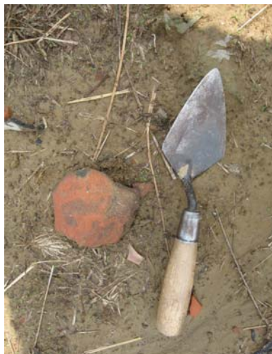
圖說：遺址西南側出土之陶器口緣